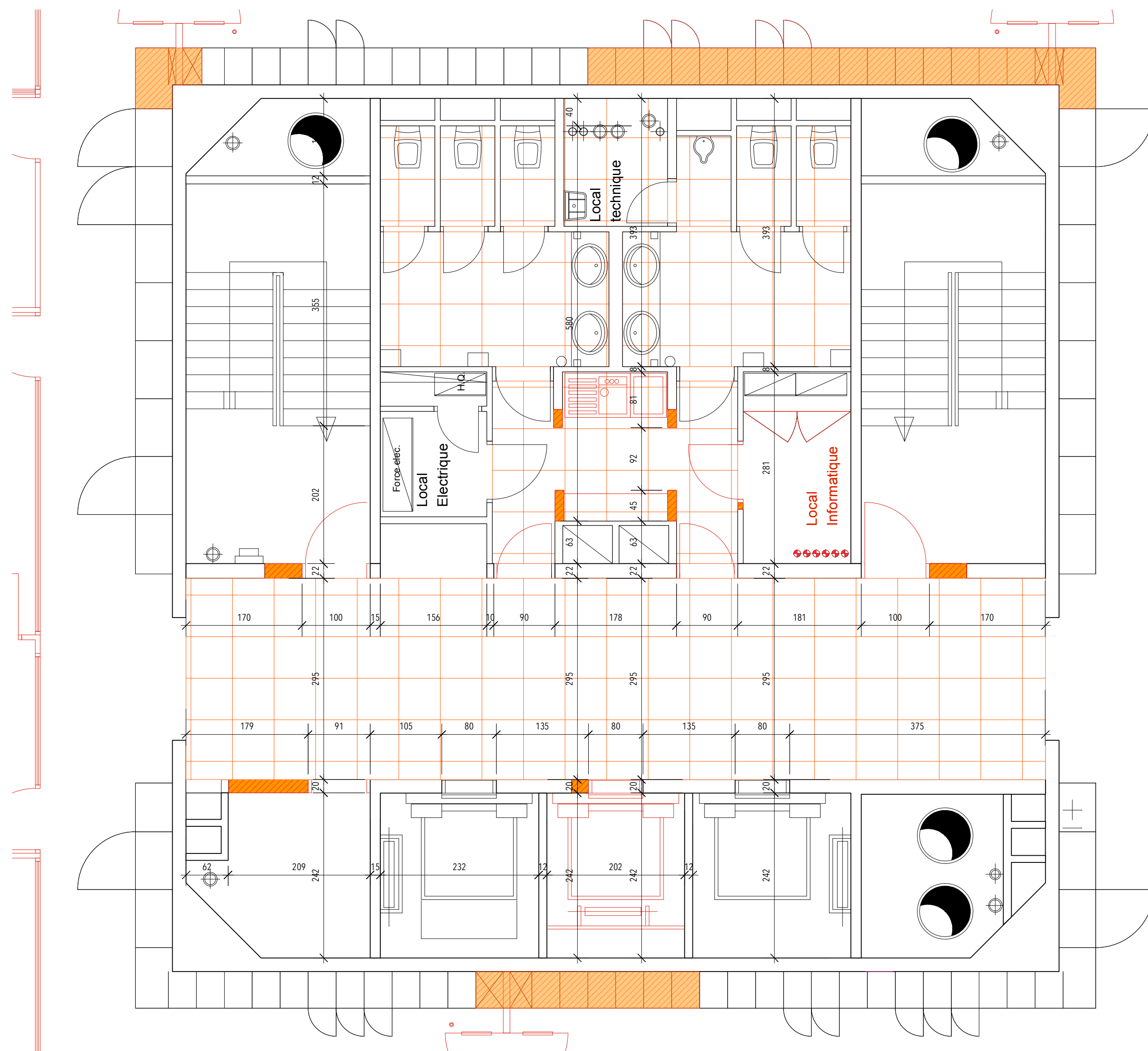
PLAN R+2/R+5 (DÉMOLITION)