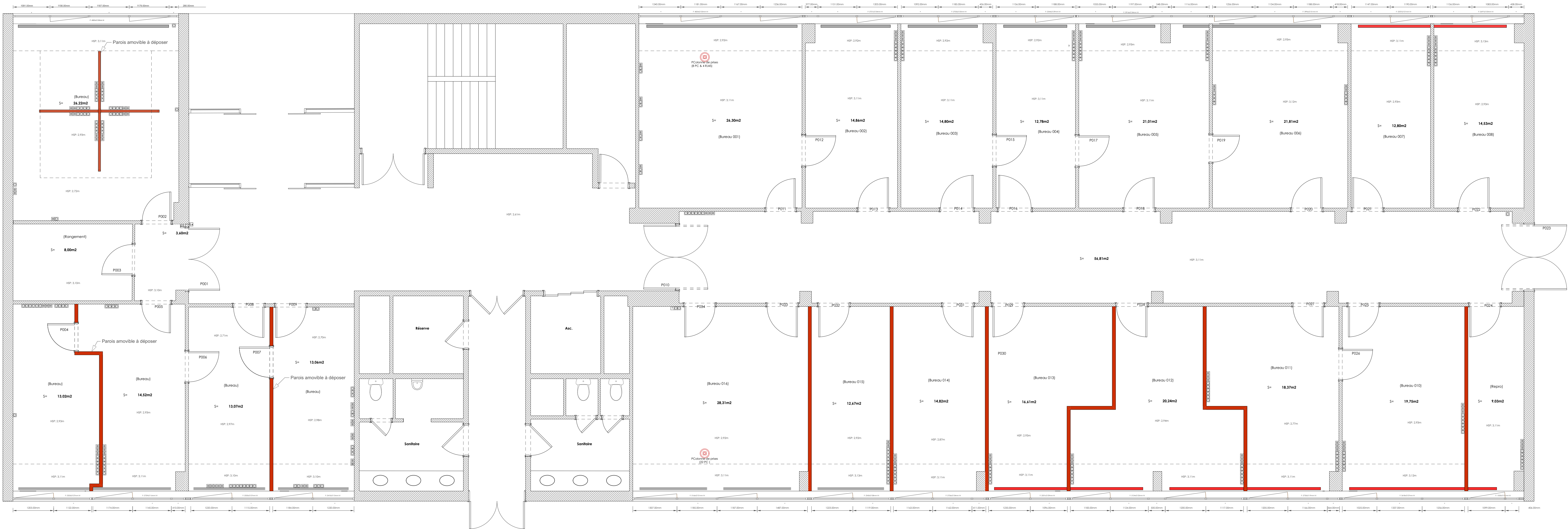
PLAN DES DEMOLITIONS 1/50