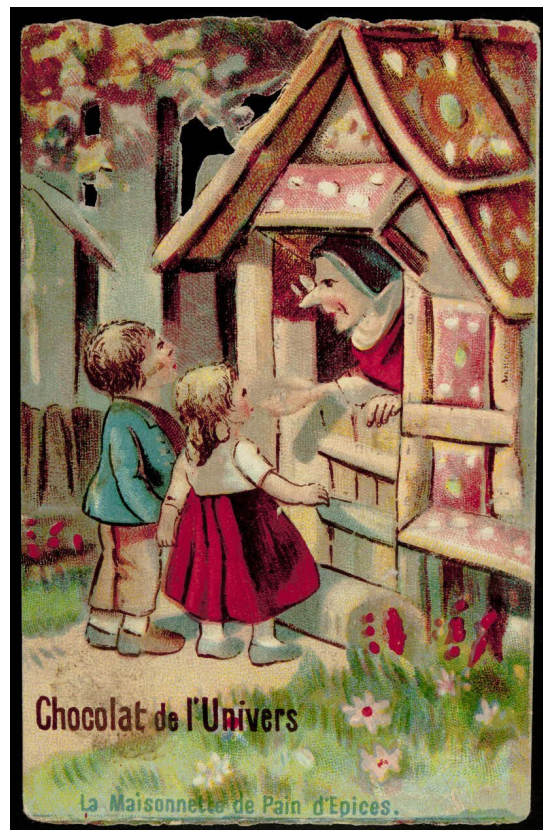
Illustration du conte des frères Grimm Hansel et Gretel, XIX e –XX e siècles. Mucem.