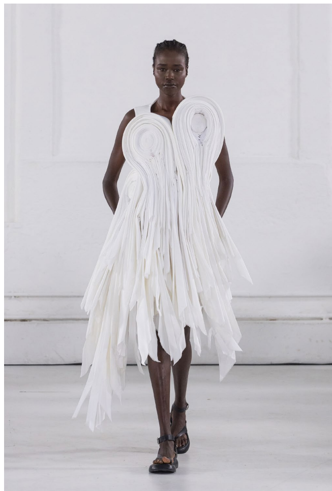
MOSSI SS25, Look 32.