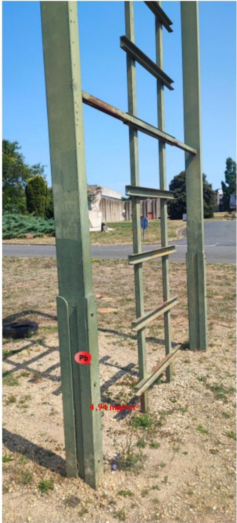
Pb Element contenant du plomb à un taux < 1mg/cm 2