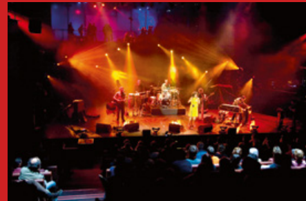
Spectacle Zuco 103.