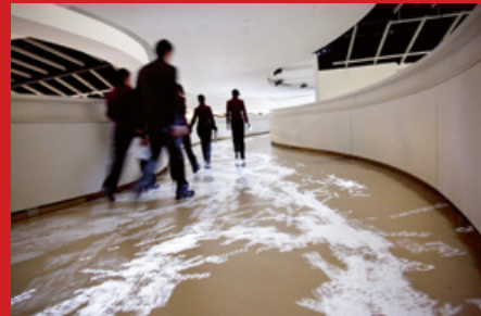
Vue sur la rampe avec l'installation multimedia par Charles Sandison.