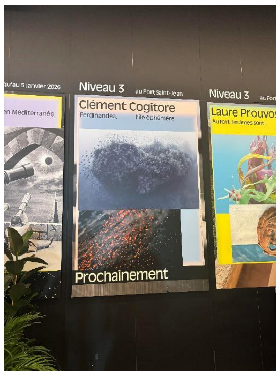
Figure 16 : Bandeau prochainement sur memento