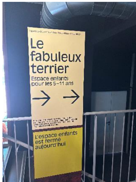
Figure 13 : Lame fabuleux terrier - RDC J4