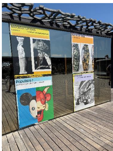
Figure 9 : Terrasse J4 - Film micro-perforé