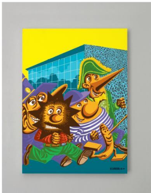
Figure 20 : Sortie exposition - J4

Retrouvez le catalogue de l'exposition à la librairie du Mucem dans le Hall