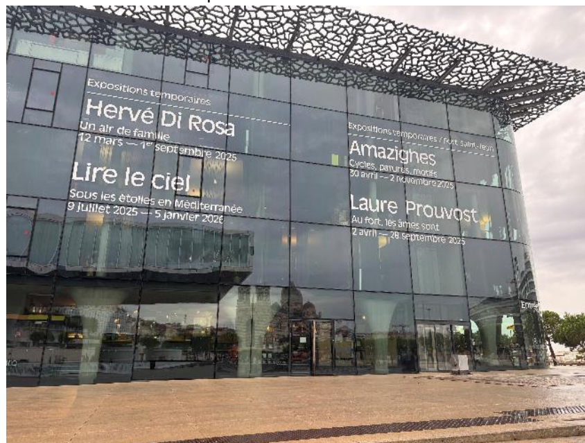
Figure 1 : Façade Est J4

La phase de nettoyage suivant la dépose de la signalétique de la façade doit être réalisée avec soin et en considérant que la visibilité des traces dépend fortement de l'orientation du soleil. Un contrôle qualité du nettoyage devra être réalisé par le titulaire, depuis l'intérieur du bâtiment administratif, avant repli du chantier, afin de s'assurer que toutes les traces de colles ou autres marques ont été retirées.