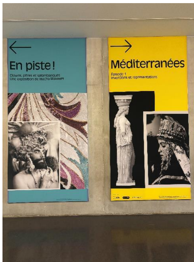
Figure 17 : J4 - R+2 - Tricotex