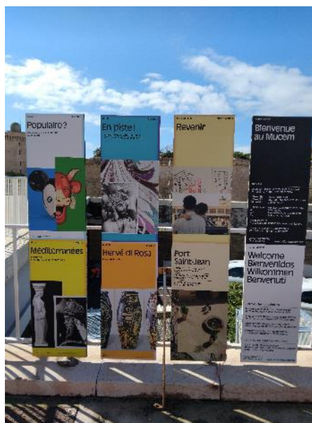
Figure 2 : FSJ - Lames entrée Vieux Port actuelles Figure 3 : FSJ - Lames entrée panier actuelles