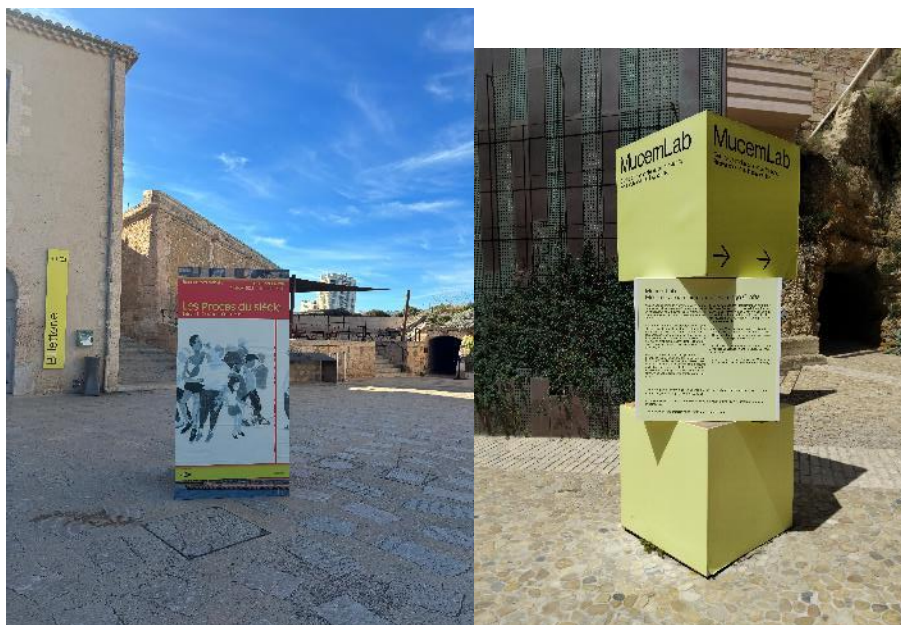
Figure 7 : Totems lestés 4 faces FJS