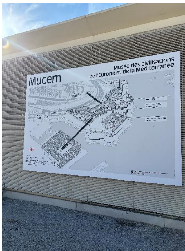
Figure 5 : Esplanade J4 - Panneau sur sortie parking indigo