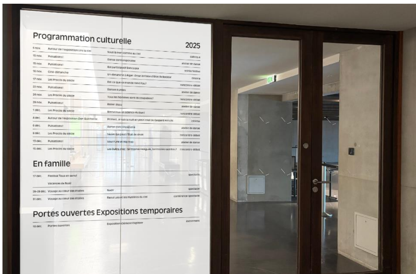
Figure 15 : Visuel BAT graphistes du programme détaillé