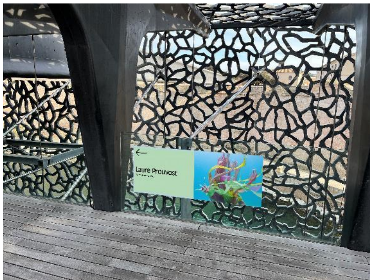
Figure 10 : Garde-corps vitré terrasse J4

Une signalétique réalisée à partir de film micro-perforée est mise en place sur la terrasse du J4, sur un garde-corps vitré à proximité de la passerelle permettant d'accéder au Fort Saint-Jean.