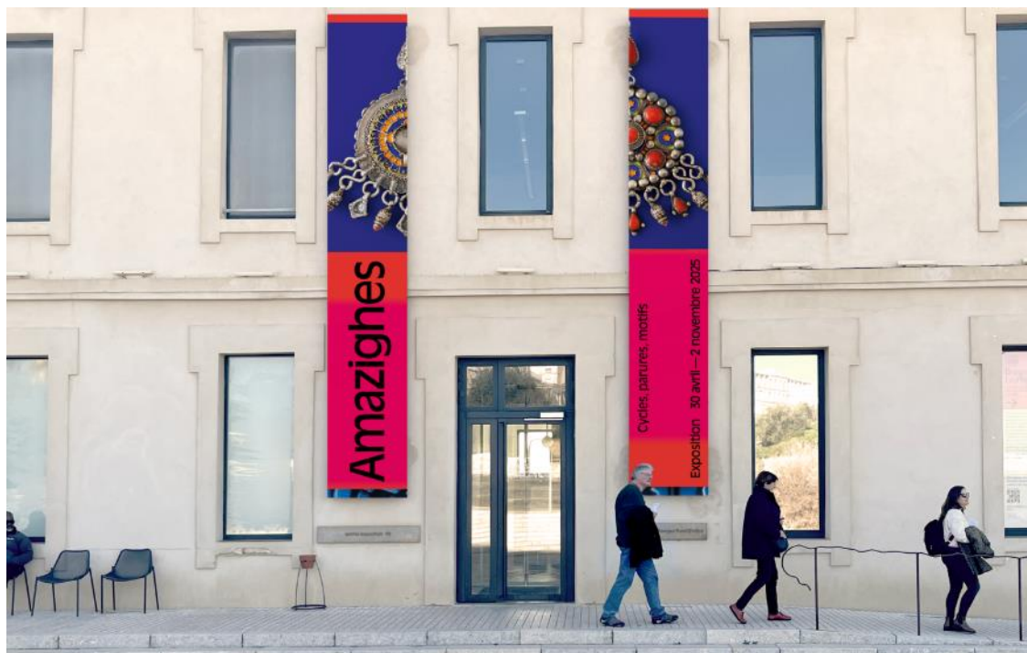
Figure 4 : FSJ - Lames GHR

Les supports ne seront pas modifiés dans le cadre de la refonte de la signalétique.