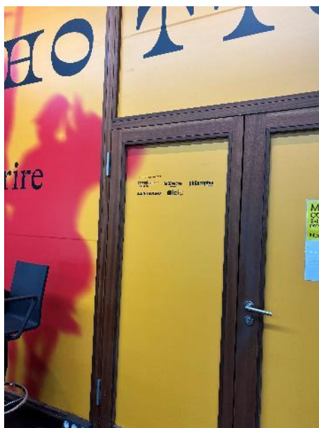
Figure 18 : Partenaires média aux entrées des expositions