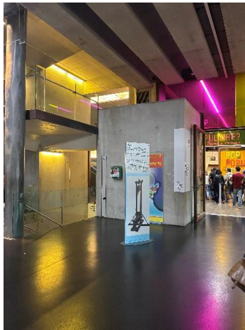
Figure 11 : Exemple de totem autoportant

Ce support n'est pas modifié dans le cadre du projet de refonte de la signalétique.