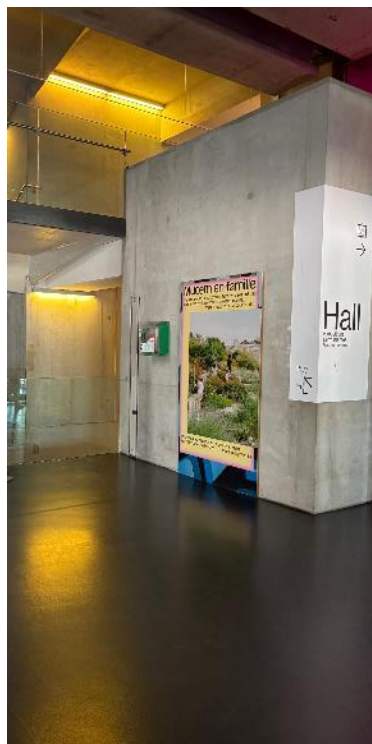
Figure 14 : J4 Hall - Adhésif sur support bois