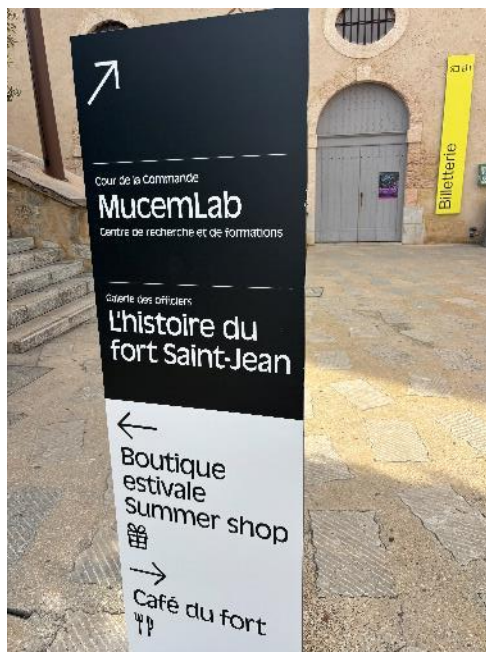
Figure 6 : Lame place d'armes FSJ actuelle