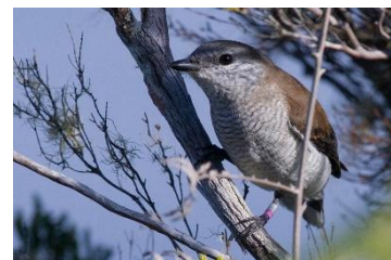
Figure 3 : Image de l'Echenilleur de la Réunion (tuit-tuit)