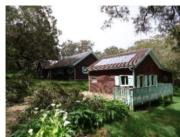
Figure 2 : Image du refuge de la Roche Écrite