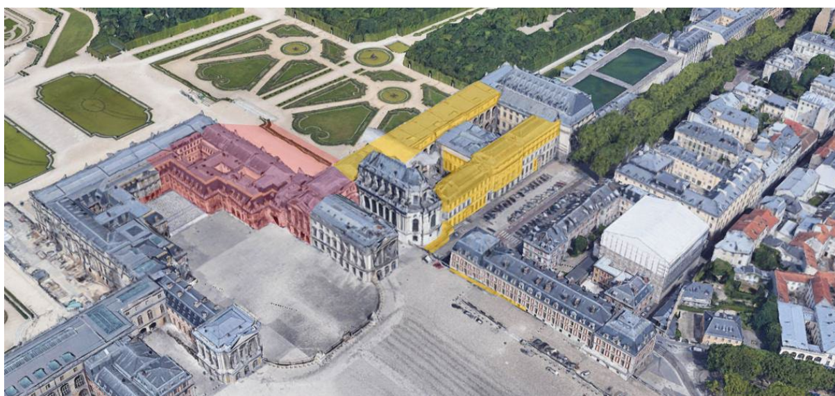
ZONE « CORPS CENTRAL NORD » EN ROUGE ET « AILE DU NORD » EN JAUNE (PHASE 2C)