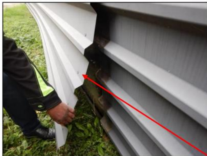
Annexe 4 – Façades endommagées