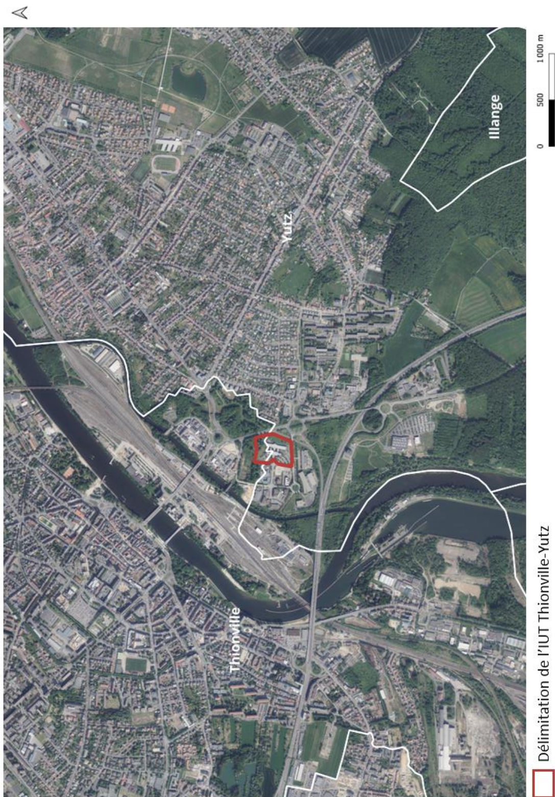
Annexe 1 – Localisation de l'IUT Thionville-Yutz