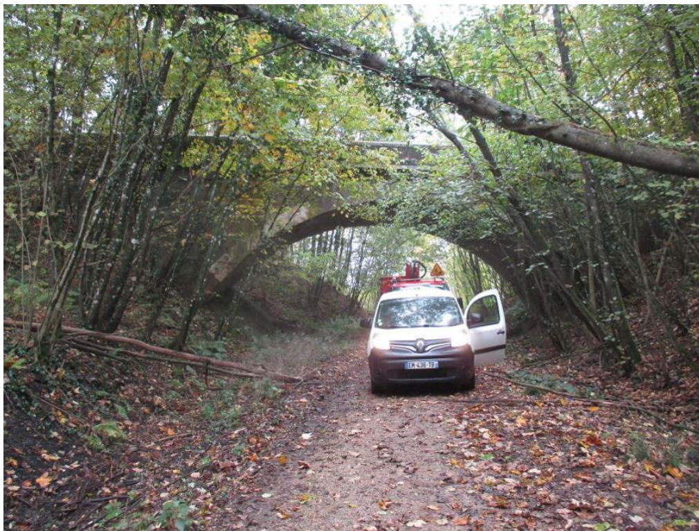
Vue de l'ouvrage

Les missions envisagées sont les suivantes :