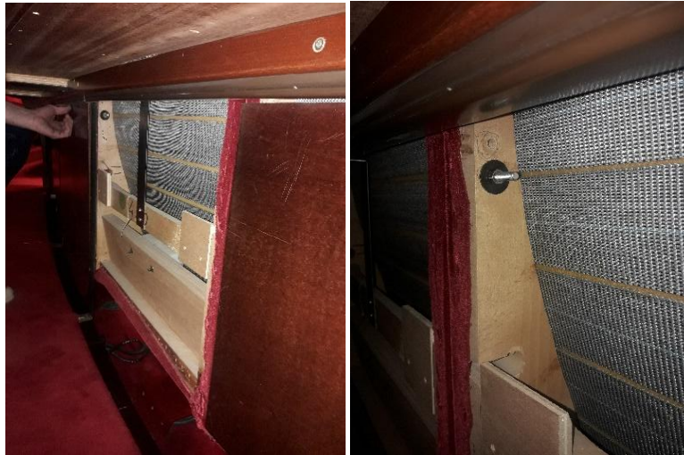
Arrière des dossiers après dépose des cache-dossiers