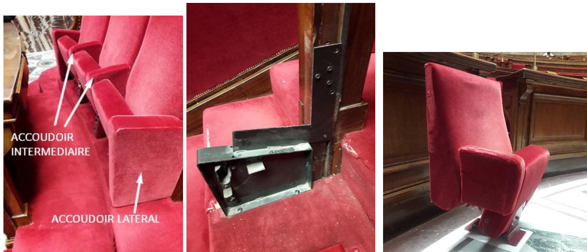
Structure des accoudoirs latéraux