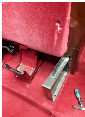
Détails en cours de dépose