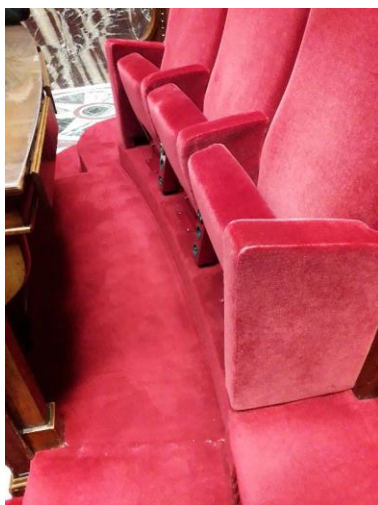
Rangée de sièges avant démontage

La dépose des accoudoirs latéraux s'effectuera en deux temps : dépose du coussin, puis dépose de la structure (contrairement aux accoudoirs intermédiaires qui sont d'un seul tenant).