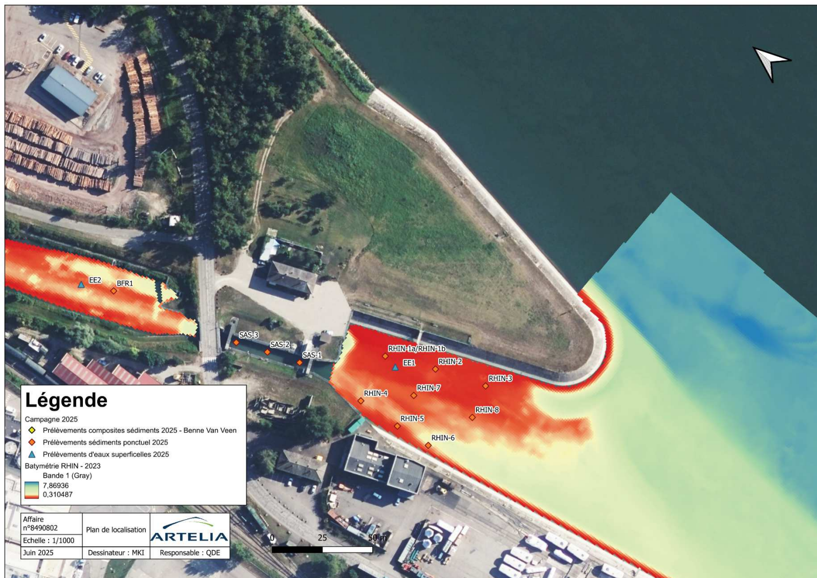
Figure 2 - Localisation des investigations prévisionnelles - RHIN