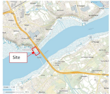
Extrait de carte IGN

Le niveau inférieur devait recevoir la ligne de chemin de fer Quimper-Brest mais n'a jamais été utilisé.