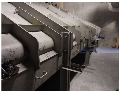
PAB vue arrière