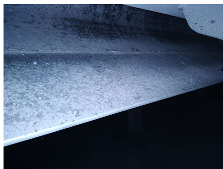
Chambre de décélération fixe