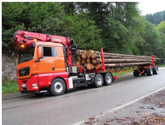
Transport de grumes

C'est pourquoi les arbres entiers sont chargés sur deux châssis pivotants équipés chacun d'une paire de colonnes. La configuration habituelle se présente sous la forme d'une plateforme qui n'est reliée au tracteur que par le chargement. Normalement, ces plateformes ont un essieu orientable contrôlé mécaniquement ou hydrauliquement par l'angle formé entre le chargement et la plateforme. Bien qu'elle soit remorquée par le tracteur par le biais du chargement, la plateforme a son propre système de freinage. Surtout en cas de freinage d'urgence, il faut une parfaite coordination entre les freins du tracteur et ceux de la plateforme en vue d'éviter que la plateforme ne transmette au tracteur des forces importantes par l'intermédiaire du chargement. Il est donc capital de soumettre ce type de véhicule à une maintenance appropriée.