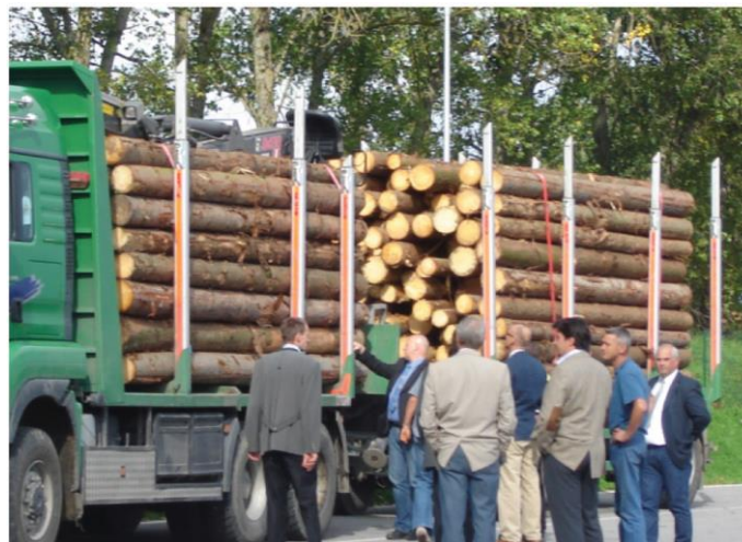
Arrimage de rondins

Les arrimages couvrants doivent être disposés (transversalement) entre les paires avant et arrière de colonnes latérales de chaque partie de la charge, aussi symétriquement que possible.