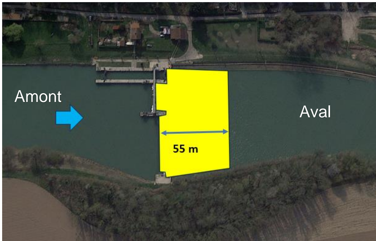
Figure 3 : Zone aval à relever

Périmètre d'intervention : Aire jaune, comprenant une zone de 55 m en aval du barrage.