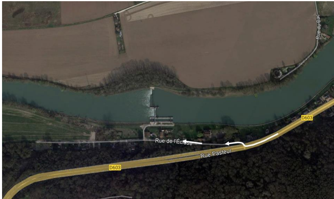
Figure 2 : Accès au barrage (pour investigations) à partir des voies publiques