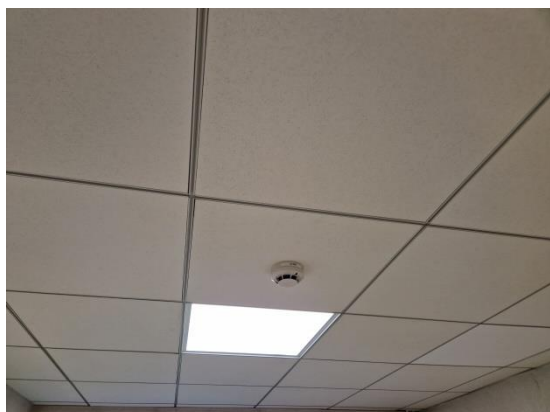
Faux plafond existant

L'entrepreneur du présent lot devra les coupes d'onglets nécessaires aux changements de direction. L'ossature nouvelle proposée devra être de même ton que l'existant.