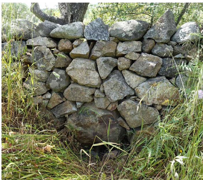
Mur déjà existant, à prolonger