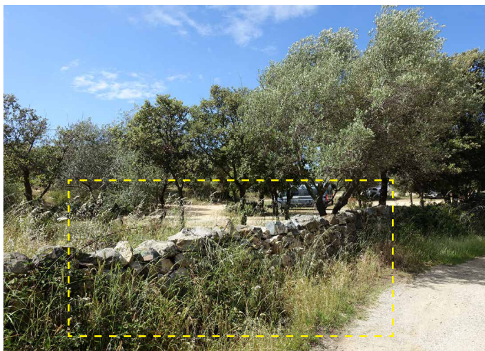
Portion de mur à ouvrir