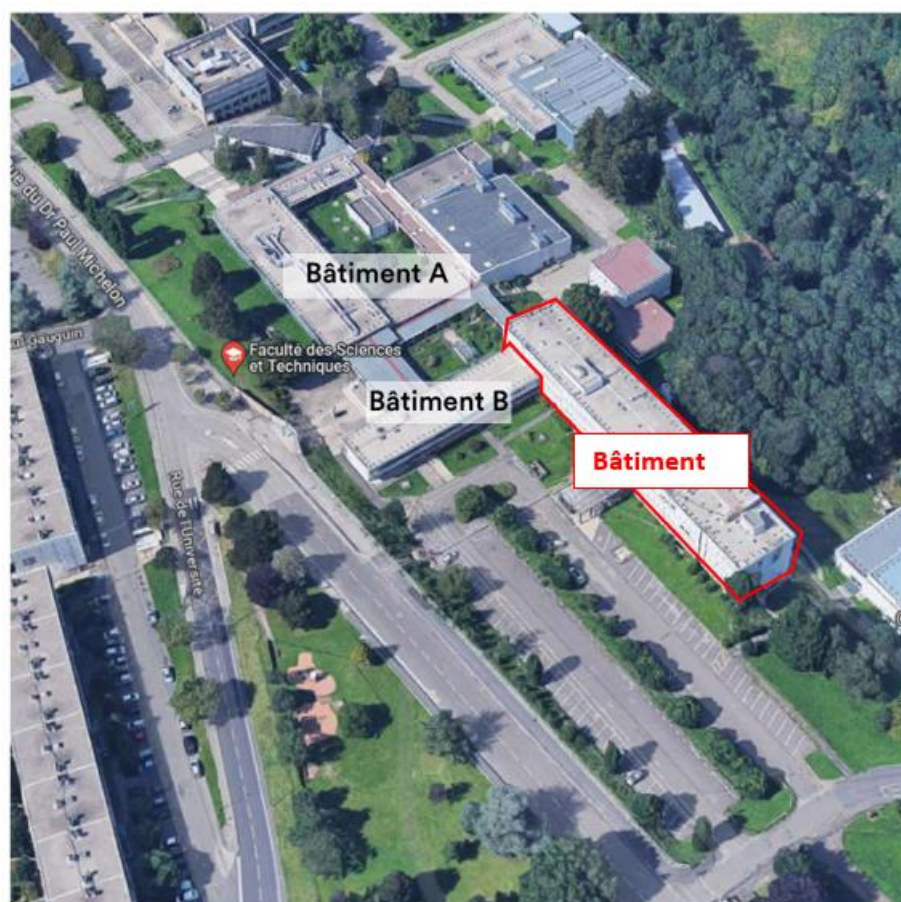
Plan de situation