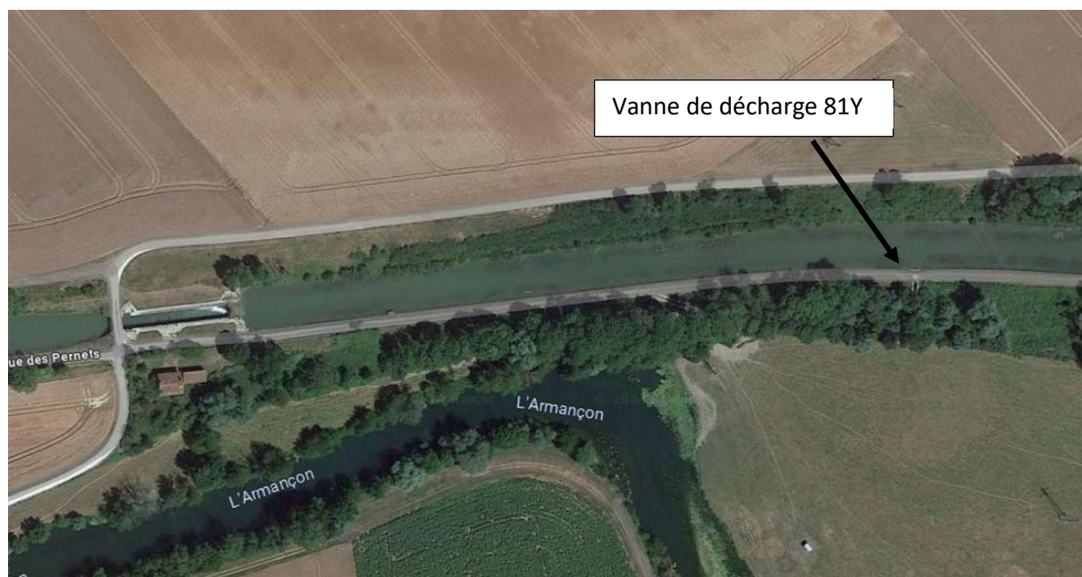
Figure 2 : photo aérienne