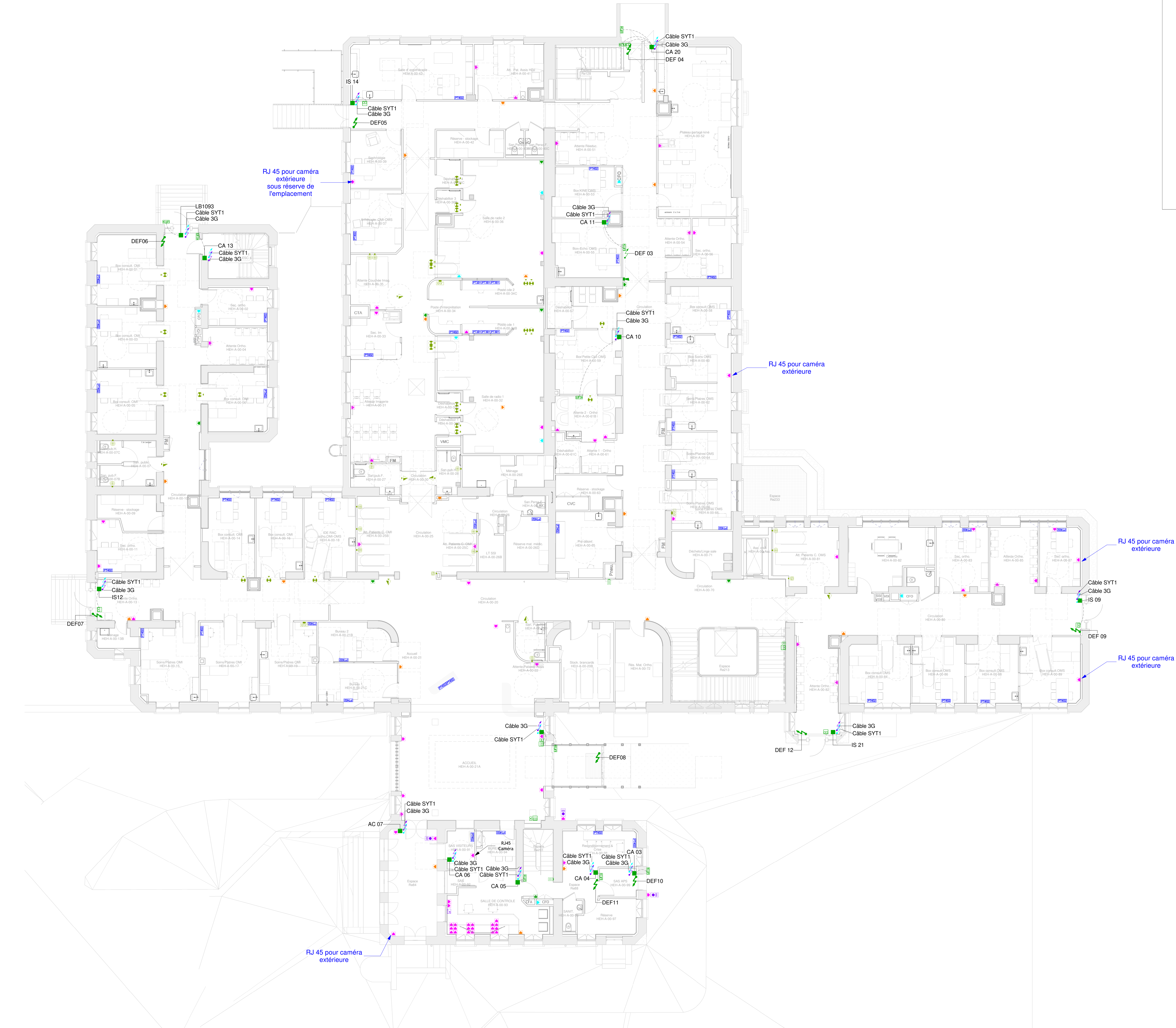
1 NIVEAU 0 - CFA 1 : 100