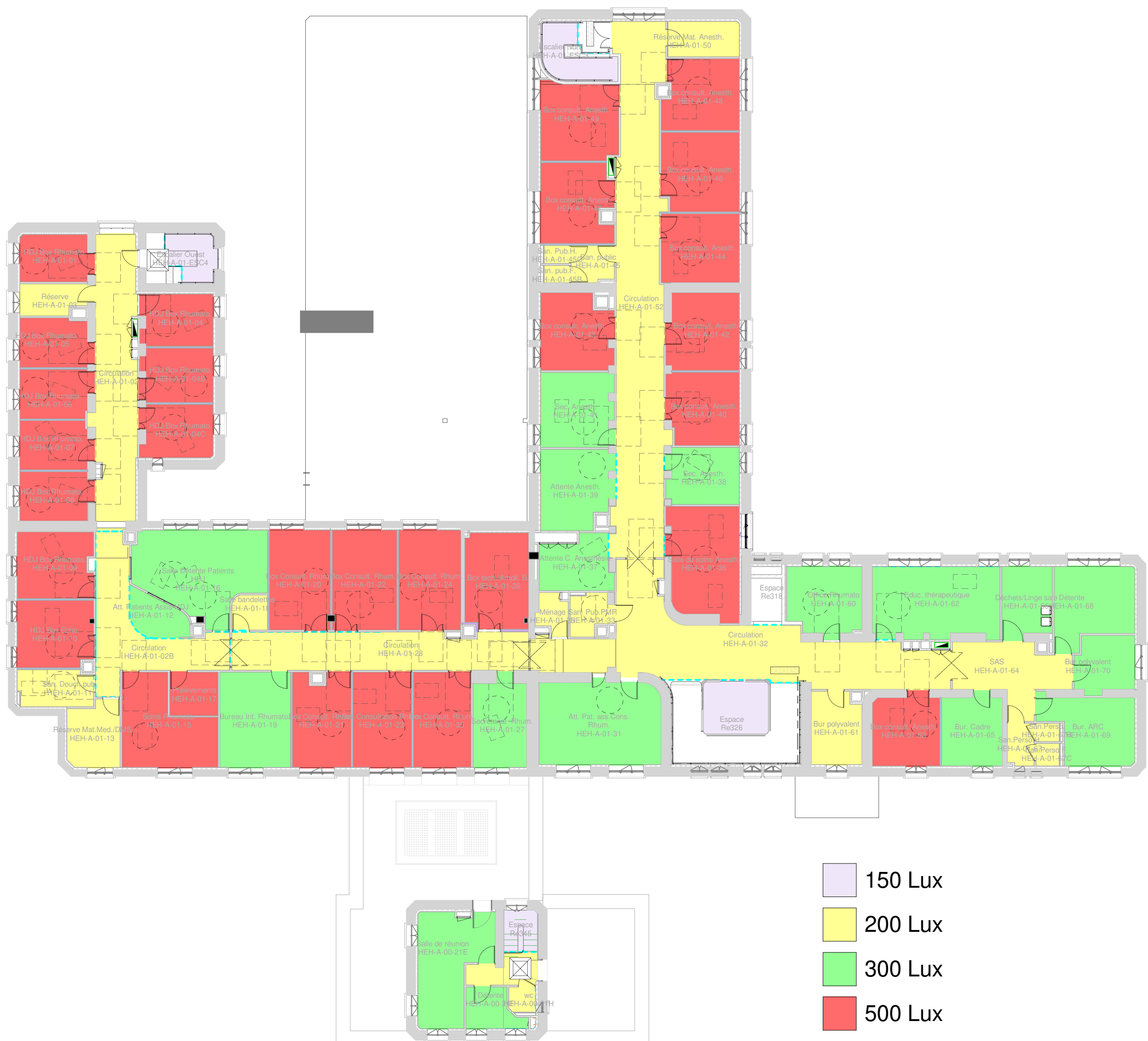
3 NIVEAU 1 - Zoning ECL 1 : 200