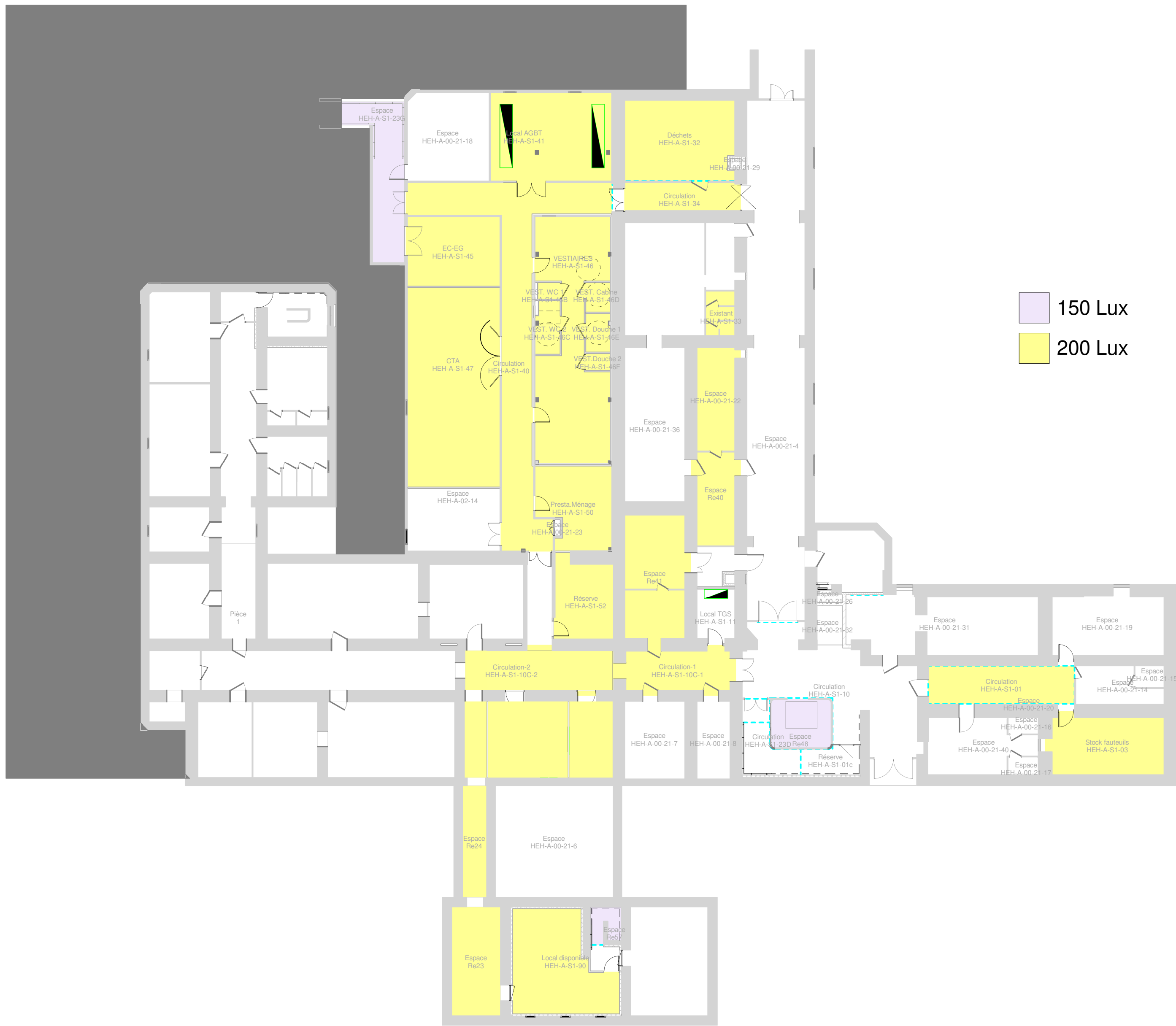
1 NIVEAU -1 - Zoning ECL 1 : 200