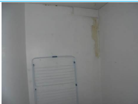
Matériaux : ZPSO-001 Prélèvement : P001; P002 Description : Enduit sur mur béton périphérique Localisation : 1er Etage - Rangement Résultat : Absence d'amiante