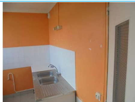
Matériaux : ZPSO-002 Prélèvement : P003; P004 Description : Enduits sur cloison plâtre Localisation : 3 ème Etage - Cuisine; 3 ème Etage - Salle de bain Résultat : Absence d'amiante