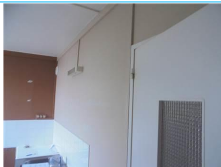
Matériaux : ZPSO-002 Prélèvement : P003; P004 Description : Enduits sur cloison plâtre Localisation : 2 ème Etage - Cuisine; 2 ème Etage - Salle de bain Résultat : Absence d'amiante