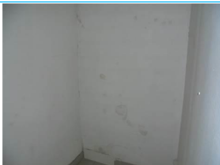
Matériaux : ZPSO-001 Prélèvement : P001; P002 Description : Enduit sur mur béton périphérique Localisation : 3 ème Etage - Rangement Résultat : Absence d'amiante