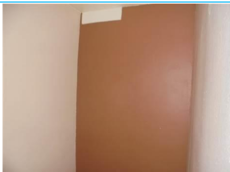
Matériaux : ZPSO-001 Prélèvement : P001; P002 Description : Enduit sur mur béton périphérique Localisation : 2 ème Etage - Rangement Résultat : Absence d'amiante