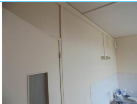
Matériaux : ZPSO-002 Prélèvement : P003; P004 Description : Enduits sur cloison plâtre Localisation : 1er Etage - Cuisine; 1er Etage - Salle de bain Résultat : Absence d'amiante