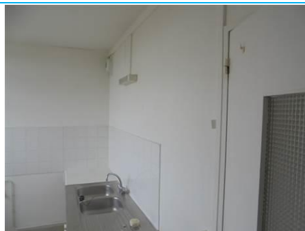
Matériaux : ZPSO-002 Prélèvement : P003; P004 Description : Enduits sur cloison plâtre Localisation : 3 ème Etage - Cuisine; 3 ème Etage - Salle de bain Résultat : Absence d'amiante