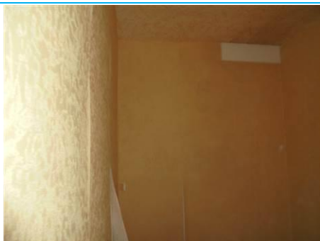
Matériaux : ZPSO-001 Prélèvement : P001; P002 Description : Enduit sur mur béton périphérique Localisation : 1er Etage - Rangement Résultat : Absence d'amiante