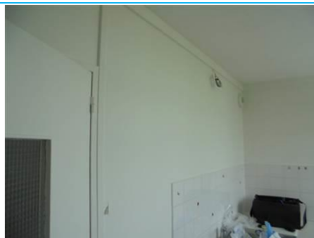
Matériaux : ZPSO-002 Prélèvement : P003; P004 Description : Enduits sur cloison plâtre Localisation : 2 ème Etage - Cuisine; 2 ème Etage - Salle de bain Résultat : Absence d'amiante