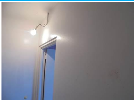
Matériaux : ZPSO-003 Prélèvement : P005; P006 Description : Enduit mur de refend Localisation : 1er Etage - Entrée; 1er Etage - Rangement Résultat : Absence d'amiante