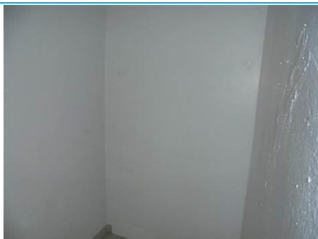
Matériaux : ZPSO-001 Prélèvement : P001; P002 Description : Enduit sur mur béton périphérique Localisation : 3 ème Etage - Rangement Résultat : Absence d'amiante