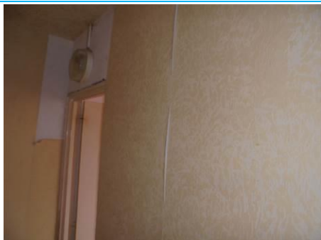
Matériaux : ZPSO-003 Prélèvement : P005; P006 Description : Enduit mur de refend Localisation : 1er Etage - Entrée; 1er Etage - Rangement Résultat : Absence d'amiante