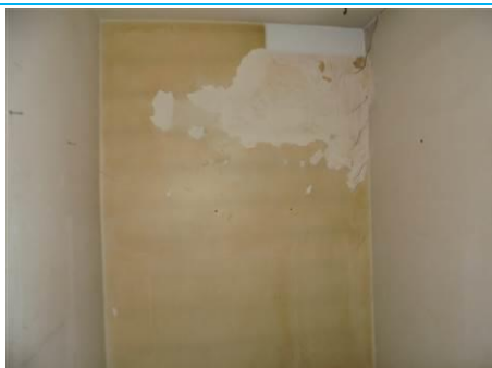
Matériaux : ZPSO-001 Prélèvement : P001; P002 Description : Enduit sur mur béton périphérique Localisation : 2 ème Etage - Rangement Résultat : Absence d'amiante