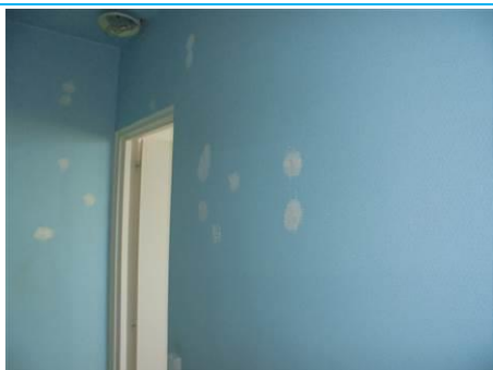
Matériaux : ZPSO-003 Prélèvement : P005; P006 Description : Enduit mur de refend Localisation : 3 ème Etage - Entrée; 3 ème Etage - Rangement Résultat : Absence d'amiante