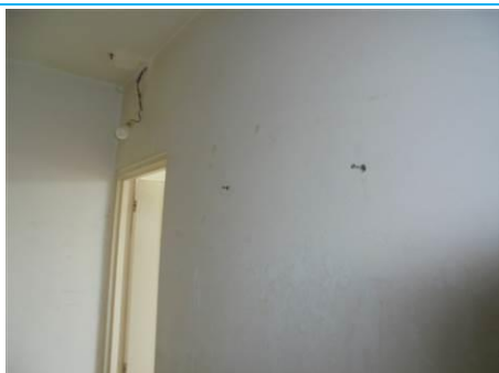
Matériaux : ZPSO-003 Prélèvement : P005; P006 Description : Enduit mur de refend Localisation : 2 ème Etage - Entrée; 2 ème Etage - Rangement Résultat : Absence d'amiante