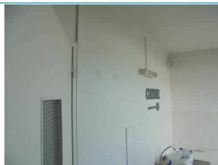
Matériaux : ZPSO-002 Prélèvement : P003; P004 Description : Enduits sur cloison plâtre Localisation : 3 ème Etage - Cuisine; 3 ème Etage - Salle de bain Résultat : Absence d'amiante