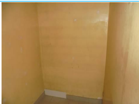
Matériaux : ZPSO-001 Prélèvement : P001; P002 Description : Enduit sur mur béton périphérique Localisation : RDC - Rangement Résultat : Absence d'amiante