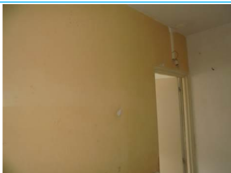
Matériaux : ZPSO-003 Prélèvement : P005; P006 Description : Enduit mur de refend Localisation : RDC - Entrée; RDC - Rangement Résultat : Absence d'amiante