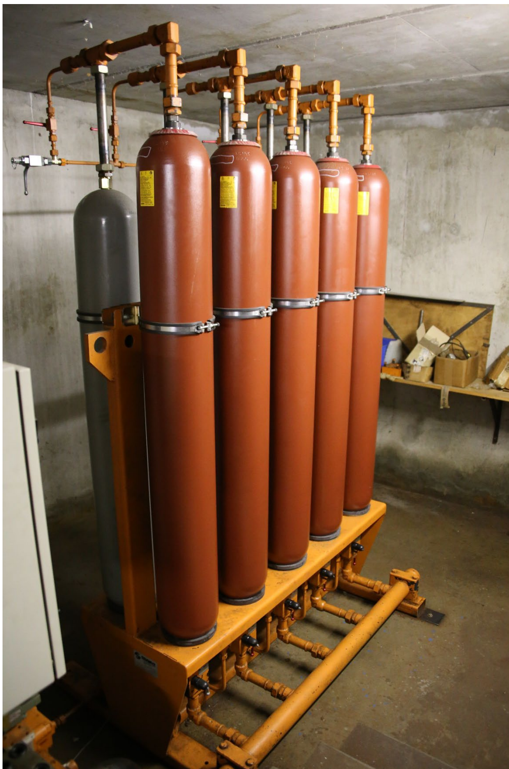
Photo2 : groupe d'accumulateurs gauche