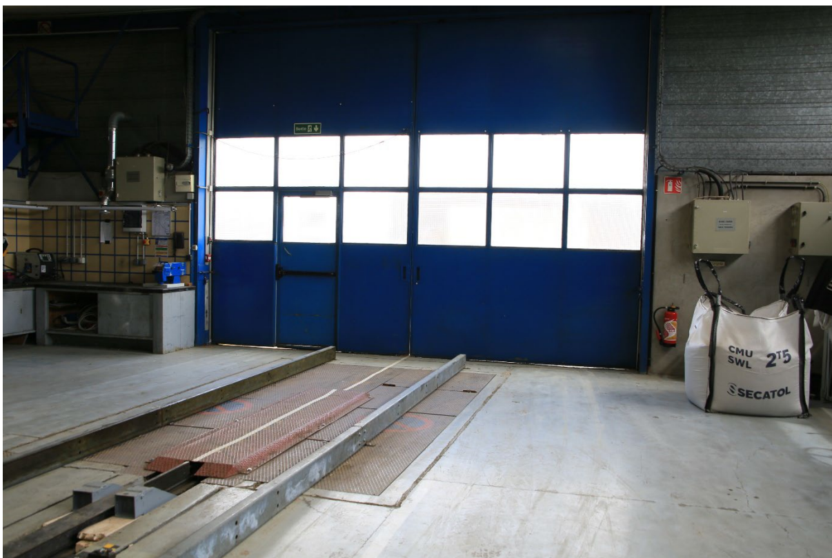
Photo5 : porte d'accès Est (6mx4m)