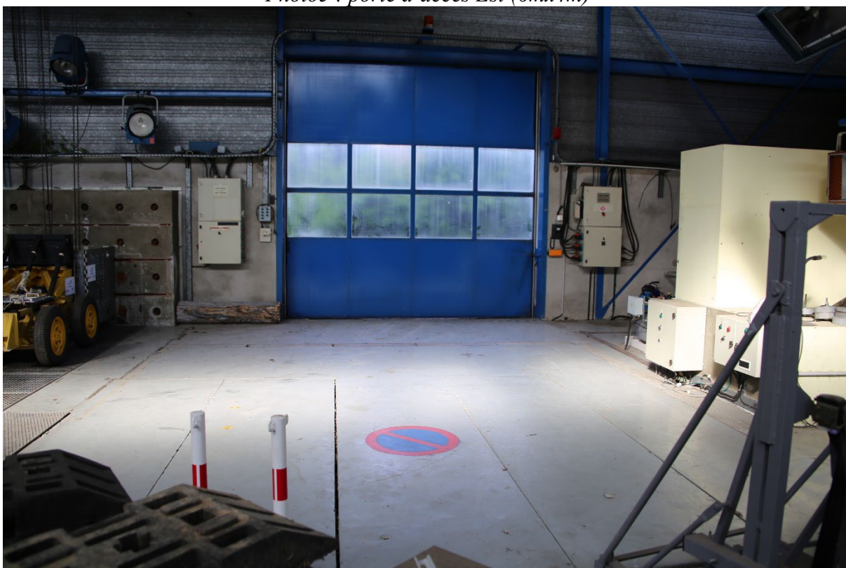
Photo6 : porte d'accès Ouest (4mx4m)

Le seuil d'accès au bâtiment depuis la porte Ouest est limité en charge à 1.5t. L'accès par la porte Est est limité à 1.8m de largeur, la zone centrale devant la porte n'étant pas circulaire.