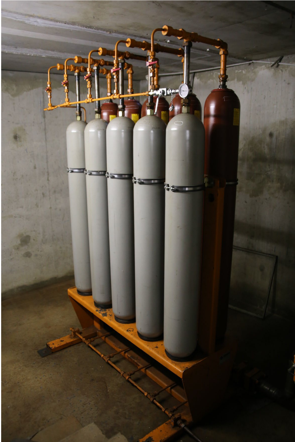
Photo1 : groupe d'accumulateur droit