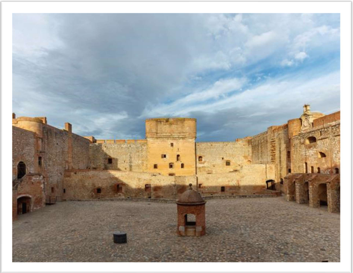
Forteresse de Salses, place d'armes

À 15km de Perpignan et des plages de la Méditerranée, la forteresse de Salses édifée au XVI ème siècle pour garder l'ancienne frontière entre la France et l'Espagne, possède une architecture impressionnante avec ses murs de 12 mètres d'épaisseur, ses galeries de contre-mine, ses tours 'artillerie et son donjon. Prévue pour abriter une garnison de 1 500 et 300 cavaliers, la visite permet de découvrir leurs lieux de vie et les systèmes de défense. Située dans un cadre naturel exceptionnel, entre les étangs de Sales et les Corbières, la forteresse offre au visiteur des points de vue remarquables et une atmosphère unique. Le site est labellisé « Qualité tourisme » et « Qualité Sud de France ».