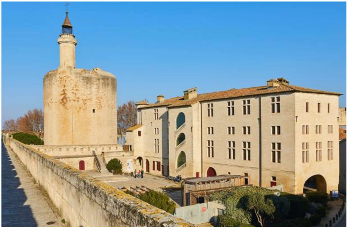
Tours et remparts d'Aigues-Mortes, tour de Constance et logis du Gouverneur vus depuis le front ouest

La ville d'Aigues-Mortes fait partie de la Communauté des Communes Terre de Camargue en Camargue Gardoise dans le département du Gard et fait partie de la Région Occitanie.