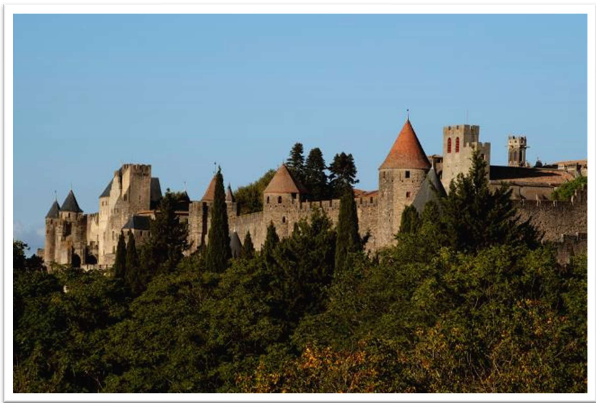
Château et remparts de la cité de Carcassonne, vue d'ensemble

Occupée depuis le VI e siècle avant Jésus-Christ, Carcassonne a été une ville romaine, fortifiée au IV e siècle, avant de devenir la typique cité médiévale que l'on connaît. Au XIII e siècle, le pouvoir royal dote la ville d'une seconde ligne de remparts, agrandit le château et l'entoure d'une enceinte. Restaurée par Viollet-le-Duc au XIX e siècle, la cité témoigne de 1000 ans d'architecture militaire et de 2500 ans d'histoire. Cet ensemble architectural exceptionnel, est inscrit au Patrimoine mondial de l'Humanité de l'UNESCO depuis 1997.