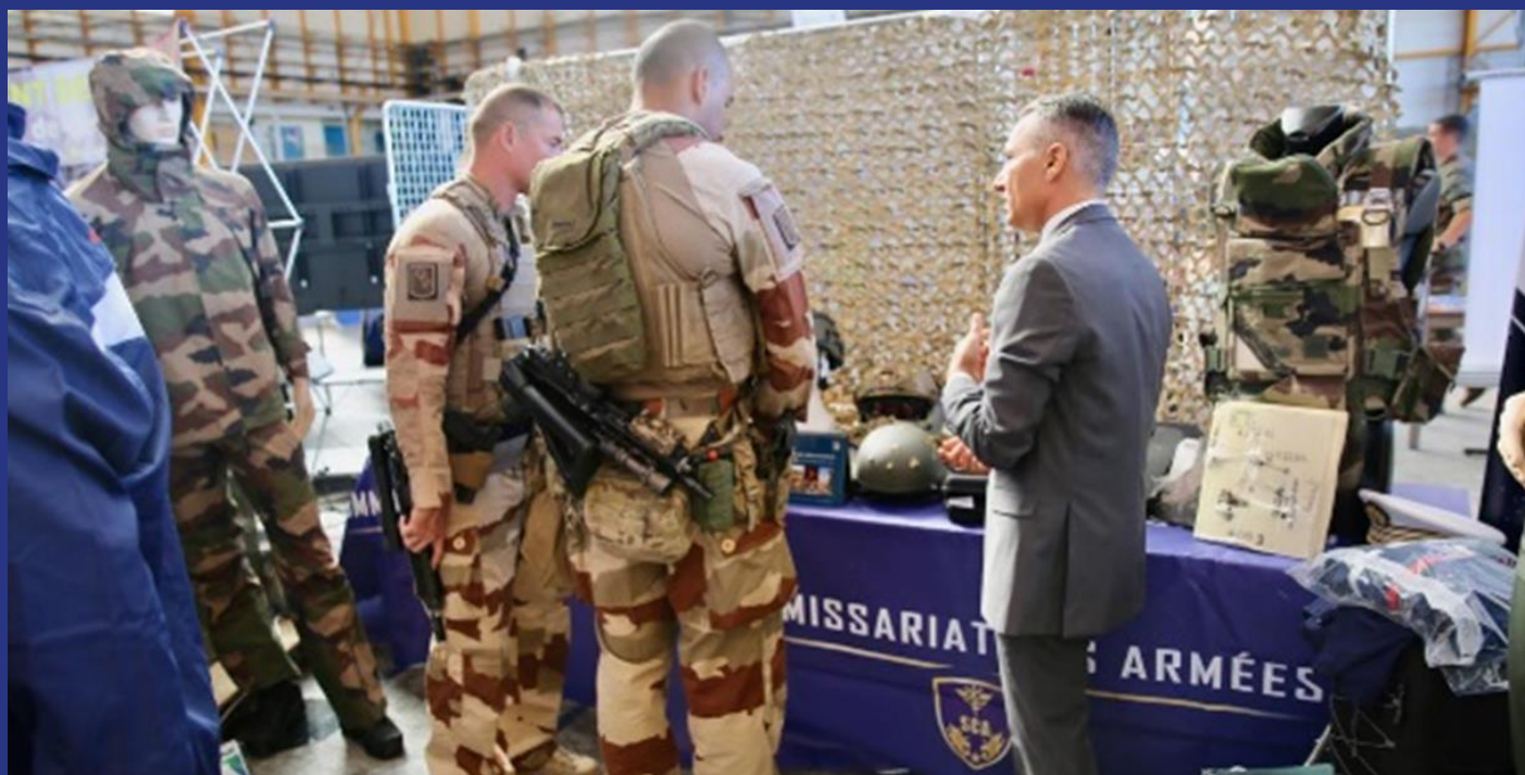
Plate-forme Commissariat Ouest (Rennes)