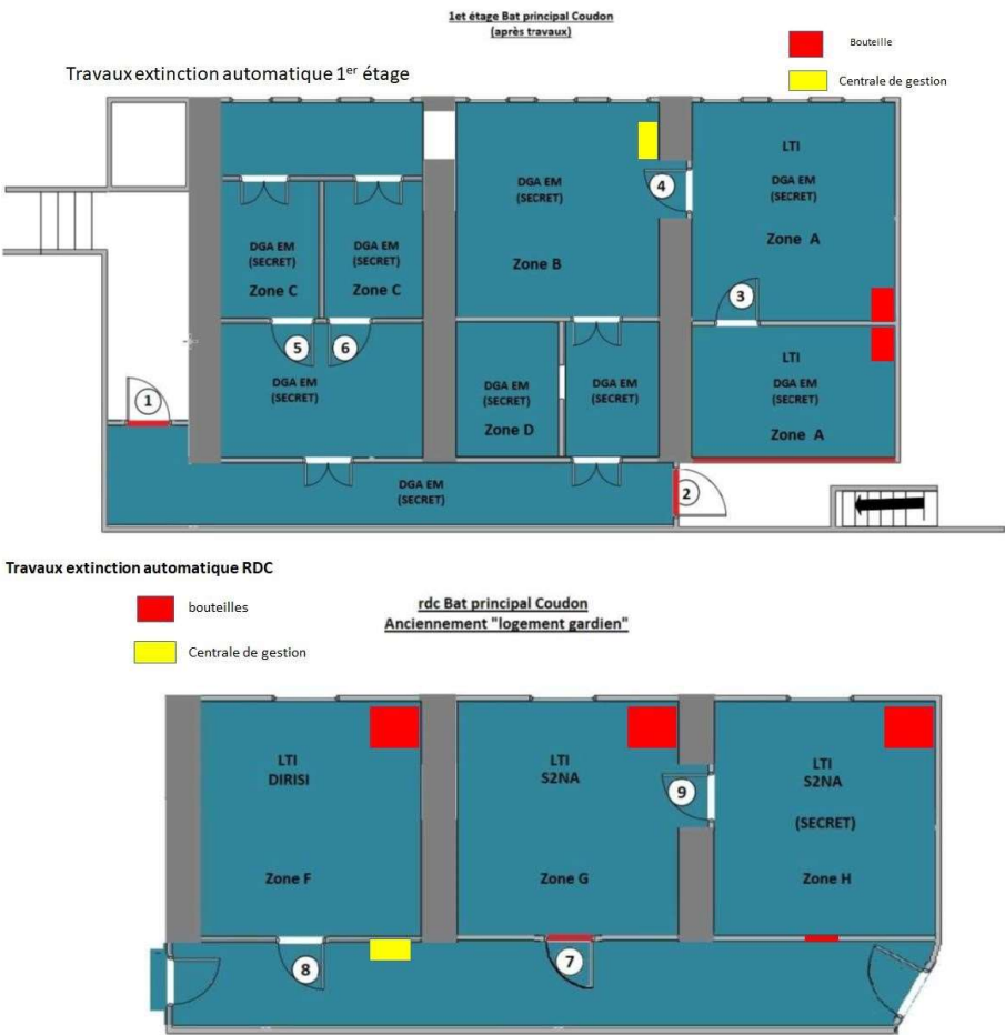
Schéma de principe d'une installation d'extinction automatique