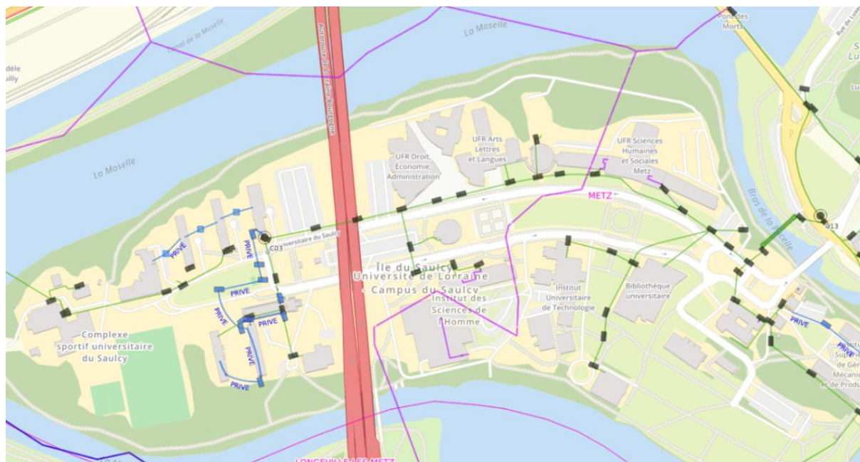
Figure 2 : Plan d'implantation des réseaux ORANGE sur l'île du Saulcy