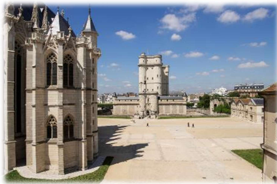
Donjon du château de Vincennes vu depuis la tour des Salves

Le Centre des monuments nationaux (CMN), établissement public administratif du ministère de la Culture, conserve, restaure, gère, anime, ouvre à la visite près de 100 monuments nationaux propriété de l'État.